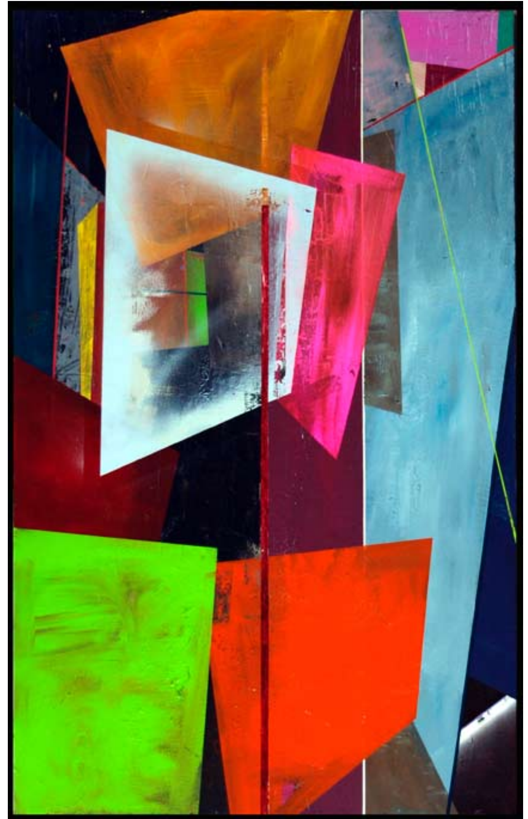
»Das große Kreischen 7«; 240x150cm; 2009. Öl/ Lack/ Acryl auf Leinwand.

He will then proceed to argue that this is he who gives the season and the years, and is the guardian of all that is in the visible world, and in a certain way the cause of all things which he and his fellows have been accustomed to behold?