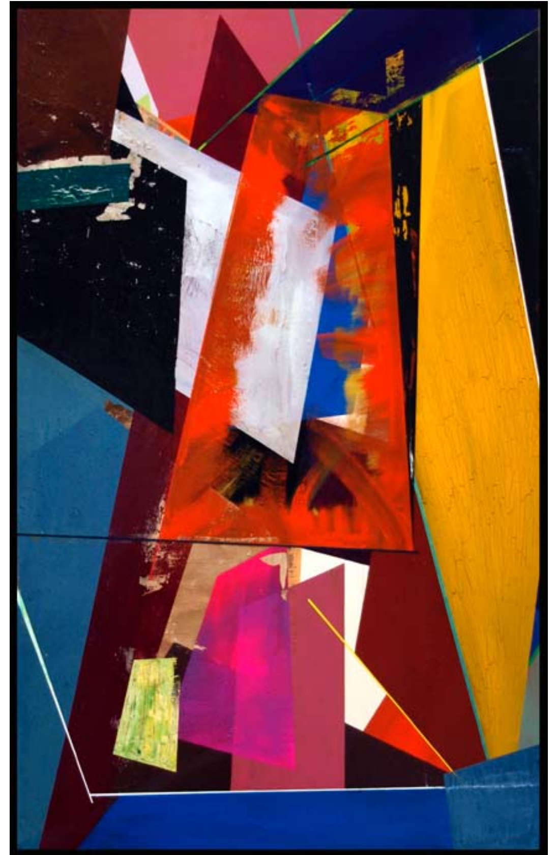
»Das große Kreischen 1«; 240x150cm; 2009. Öl/ Lack/ Acryl auf Leinwand.

Plato's Cave Allegory – synonym for the pursue of knowledge, of truth, of the object-as-such in its original existence, independent from human examination. An optimistic synonym however: While a doctor Faust has to sell his soul to Mephistopheles in the hope of gaining true knowledge, the Platonic human in principle possesses the ability to gain knowledge autonomously. While in everyday life it may be the case that we only perceive shadows of images of things-as-such, all disciplines in arts and humanities to some extent employ the platonic ambition to advance towards the gaining of true knowledge.