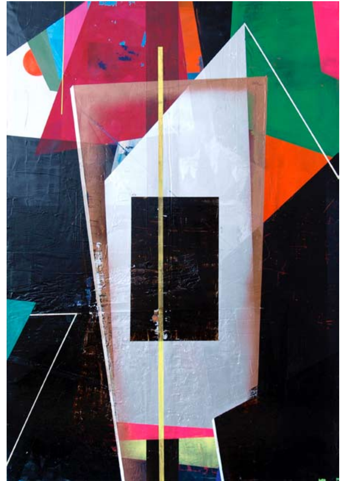
»Rheingold - 04«; 280x190cm; 2010. Öl/ Lack/ Bitumen auf Leinwand.

With his Reformation of the Idea, Behn »humanises« the idea-as-such, transcends its unattainability and breaks free from the ideal of harmony: Behn's Reformation of the Idea is, in Adorno's sense, the »elaboration of truth in art« (ibid. page 168).