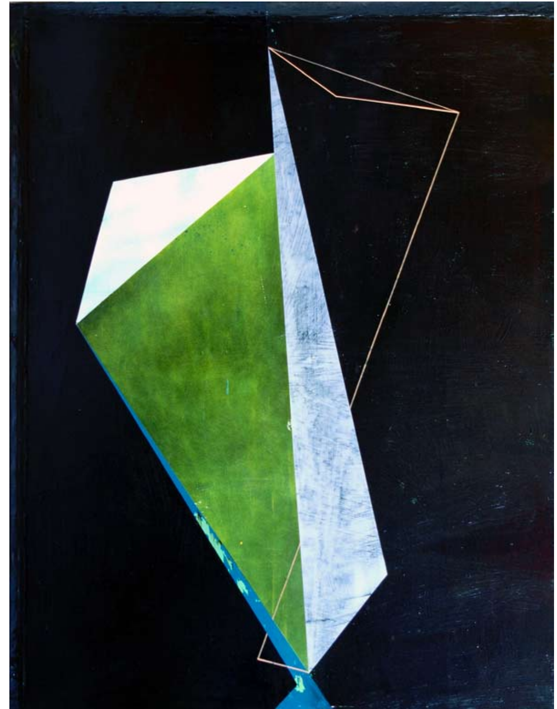
»John Cage No3«; 200x155cm; 2011/12. Öl/ Lack/ Bitumen auf Leinwand.

The series »John Cage« out of 2011/2012 can be regarded as an extreme here: The impression of balance and weightlessness, provoked by the deep black background and the floating forms is immediately deconstructed by the brutal destroying of the surfaces.